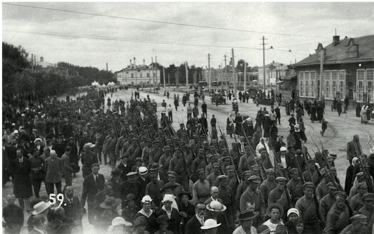
Первый стрелковый полк Яна Гуса Чехословацкого корпуса в Казани на Арском поле. 1918